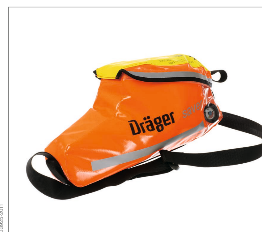
Dräger Saver CF Soft Bag