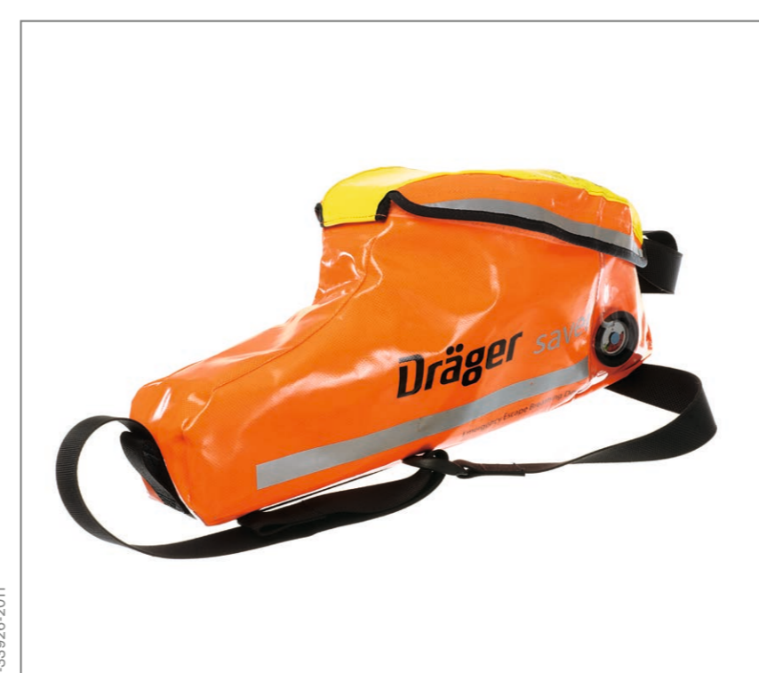
Dräger Saver PP Soft Bag