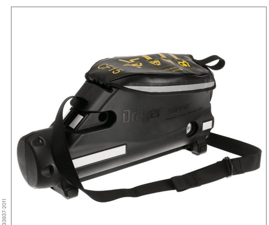
Dräger Saver CF Hard Case