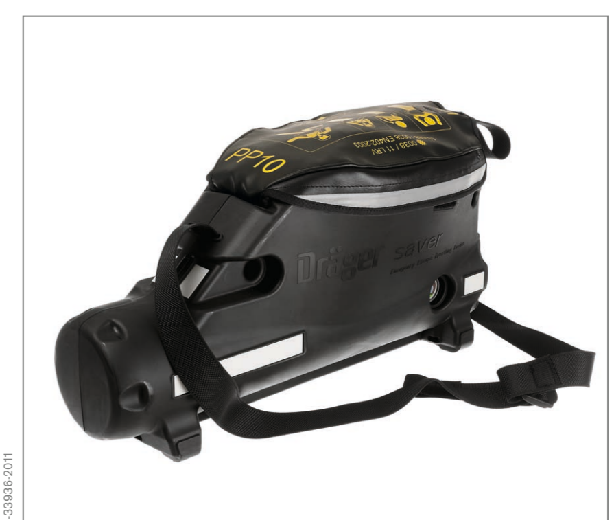
Dräger Saver PP Hard Case