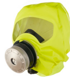
Dräger PARAT® 5500 brandvluchtbank

Vervangt u na 8 jaar het filter, dan wordt de levensduur verlengd naar in totaal 16 jaar. Dat levert u op lange termijn een grote kostenbesparing op. Het filter kan men na een gerichte Dräger-opleiding heel eenvoudig zelf vervangen.