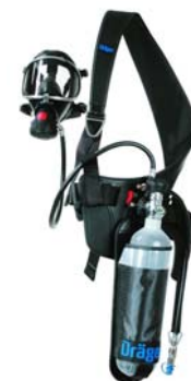
Dräger PAS Colt - EN 402 Ergonomisch ontwikkeld harnas