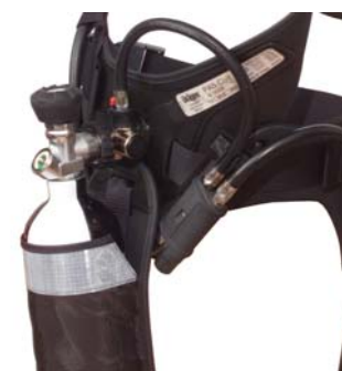
Dräger PAS ASV Ononderbroken luchttoevoer